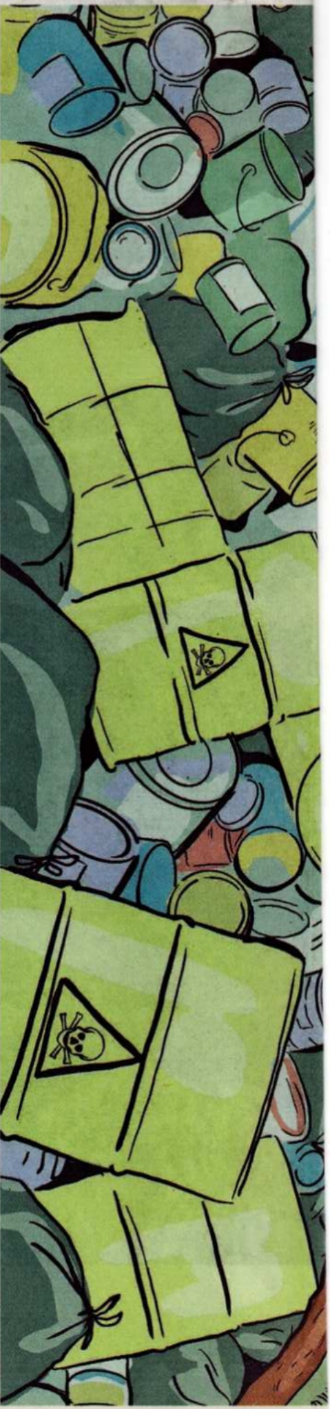
ILLUSTRATIE ROSANNE VAN LEUSDEN