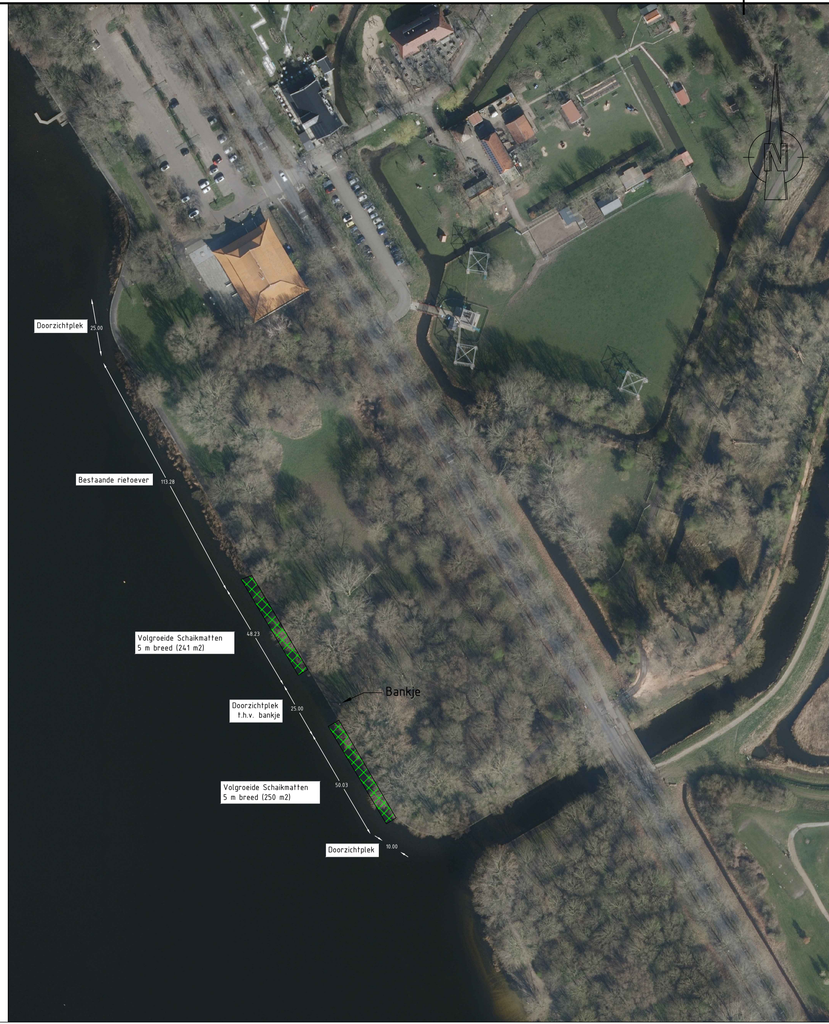
BOVENAANZICHT Schaal 1:1000